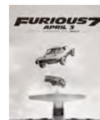
FASTE AND FURIOUS 7